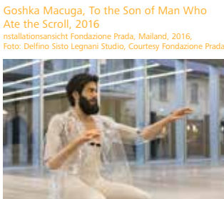
Goshka Macuga, To the Son of Man Who Ate the Scroll, 2016