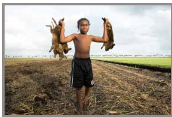
© „The Rabbit Hunt“ - Patrick Bresnan

Datum: 01. bis 06.06. Orte: Gartenbaukino, METRO Kinokulturhaus, Österreichisches Filmmuseum und erstmals auch Filmcasino Tickets: www.viennashorts.com