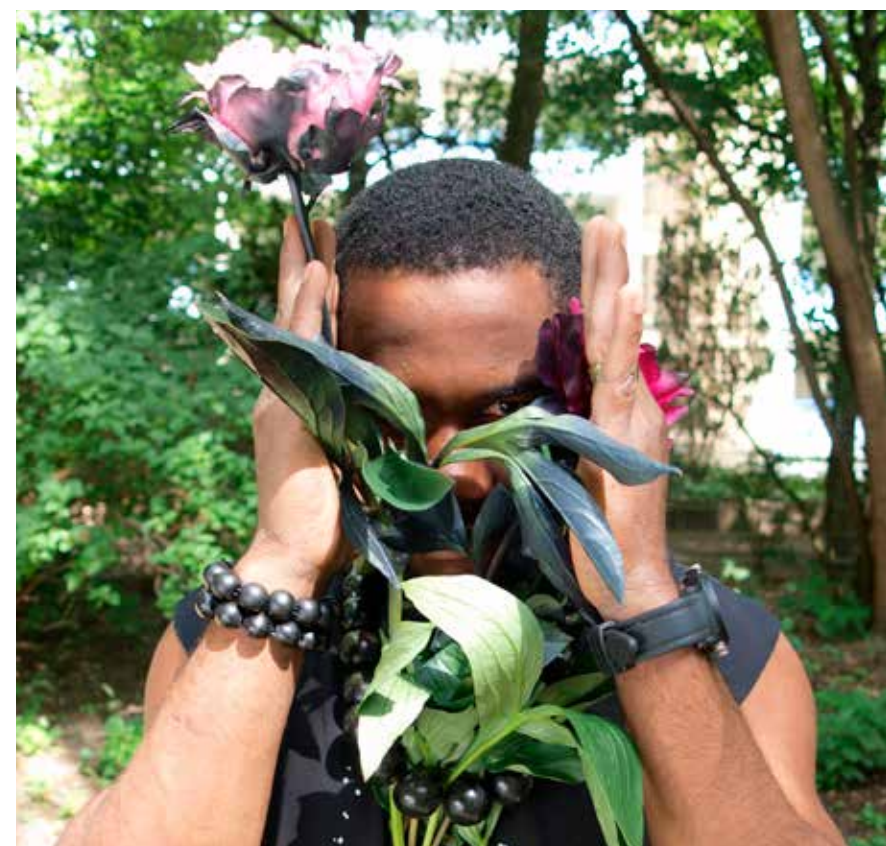
Wiener Festwochen 2017 Die selbsternannte Aristokratie