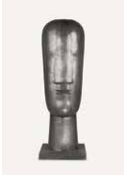
Joannis Avramidis, Großer Kopf, um 1970