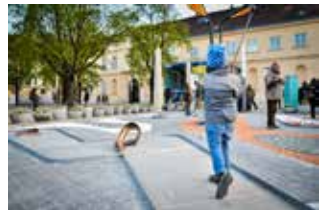
MQ Amore