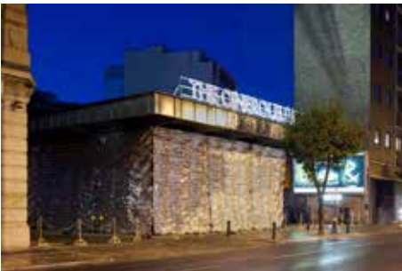
Zur Veranstaltung: Vortrag Assemble Das Cineroleum, ein temporäres Kino in einer Tankstelle markiert den Gründungsmoment von Assemble