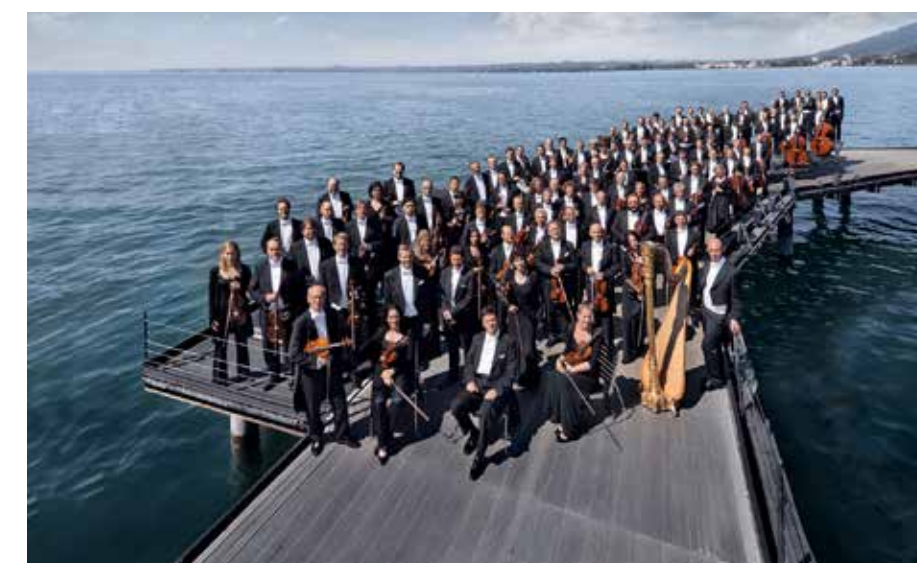
MuseumsQuartier Wien Wiener Symphoniker

und über 100 weitere Ausstellungen, Veranstaltungen und Workshops